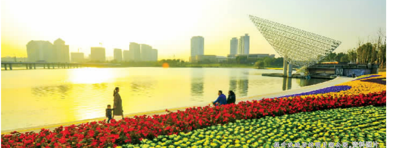
提升改造后的明月湖公园。资料图片

场馆建设改造,完成省园博会主展馆、园治园、民俗村和13个城市展园的新建布展,实现城市南部快速通道、金湾路等城市骨干道路全面建成通车,开工建设以江平路改造为主体的城市北部快速交通体系。(下转3版)