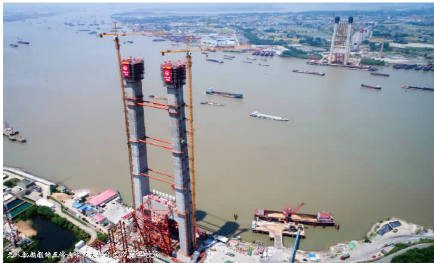
无人机拍摄的五峰山长江大桥南塔塔顶封顶

抓好事、花事工作筹备,通过丰富多彩的活动把人留下来;要尽早谋划开幕式与相关活动组织筹备,按照“隆重、喜庆、节俭、安全”的要求制定好方案,争取一炮打响;要进一步加强对筹备工作统筹协调,注重发挥好“后园博会”效益,形成永