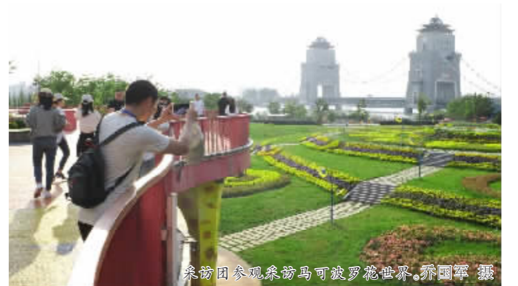
来扬团参观参观马可波罗世界,异国风采

“扬东智能团队虽成立时间短,但研发能力强而高效,我们要在扬州做国内首家实现空地一体化安防联控平台并运营的企业。”徐宏哲解释,借助这个平台,可实现空中无人机和地面机器人联合作业。公司计划将核心组件的研发逐步搬到扬州,将扬东智能打造成国内无人产业研发的“火车头”。 (下转4版)