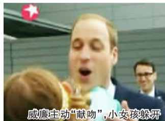
威廉主动“献吻”，小女孩躲开