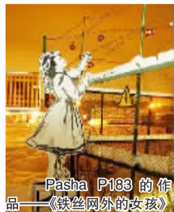
Pasha P183的作品——《铁丝窗外的女孩》

由于捕获到了当今俄罗斯的思潮，P183迅速在全世界的范围内名声大噪。由于其绘画风格与世界最著名的街头艺术家、英国的班克斯颇有几分神似，P183常被世人誉为“俄罗斯的班克斯”或者“班克斯基”。不过他坚称自己从来没想到要模仿班克斯，因为这是对其个人风格的轻视。和大多数街头艺术家一样，P183的作品总是很快就被当局政府用灰色的油漆覆盖起来。不久前，P183接到一个项