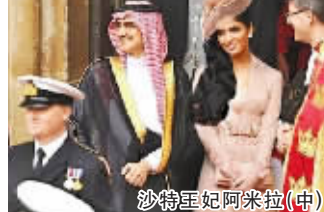
沙特王妃阿米拉(中)

阿米拉上过美国的《新闻周刊》等媒体，接受过英国著名媒体人摩根的采访，还曾入选《中东CEO》杂志2012年阿拉伯世界百大最有影响力女性榜。她的丈夫阿尔瓦利德是沙特阿拉伯国王的侄子，身家约180亿美元，是世界上最有男人之一。