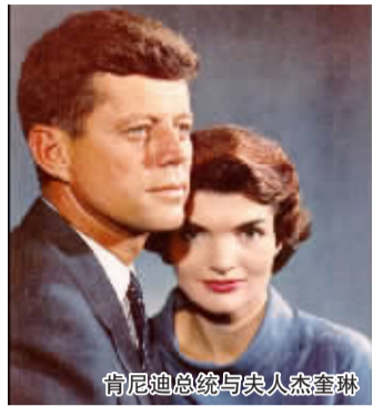
肯尼迪总统与夫人杰奎琳

据《国民问询报》5日报道，一本即将出版的新书《感觉良好博士》惊爆秘闻——上世纪60年代初，刚刚当上美国总统的肯尼迪为缓解压力摆脱痛苦，竟染上严重毒瘾。1962年，由于一次药物注射过量，处于躁狂状态的肯尼迪竟彻底失控，全身赤裸地在纽约豪华酒店的走廊上裸奔！