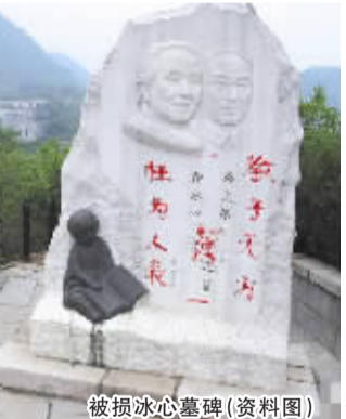
被损冰心墓碑(资料图) 除字迹,主要考虑到需要时间作准备,更主要的是等待气温上升,方便清除。 昨日上午,记者打通吴山的电话,了解仍未修复墓碑的原因。吴山表示此事由律师出面介绍相关情况。而对于其律师的联系方式,吴山表示他人在外地,不记得律师的电话。

13日晚,广东揭阳市委宣传部通报称,13日下午,揭阳市揭东区召开第一届人民代表大会常务委员第二次会议。会议决定免去江中咏同志的揭阳市揭东区人民政府副区长职务。 5月9日,一则有关《揭阳“官二代”27岁任副县长,父子同为领导》的报道引发各方热议。据揭阳市委宣传部通报称,江中咏任职的主要问题:2004年11月,江中咏同志报考普宁市公安局办事员,经考试,2005年9月,揭阳市公安局同意录用江中咏为国家公务员(人民警察),2005年11月揭阳市人事局批准同意录用江中咏为国家公务员(人民警察)。2006年11月,普宁市人事局同意江中咏正式任职定级为普宁市公安局办事员。2006年12月揭阳市人事局同意江中咏公务员登记。2007年1月,江中咏转任揭东县炮台镇党政办公室办事员。2007年3月,揭东县炮台镇党委任命江中咏同志为镇团委副书记。该同志任办事员才4个月。《公务员职务任免与职务升降规定(试行)》(中组发7号)第二十条之(七)规定:晋升科员职务应当任办事员三年以上。第三十一条规定:对违反本规定作出的决定,由有关机关予以纠正。(中新)