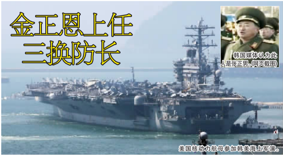
美国核动力航母参加韩美海上军演。