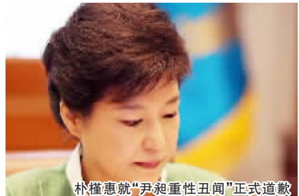
朴槿惠就“尹昶重性丑闻”正式道歉