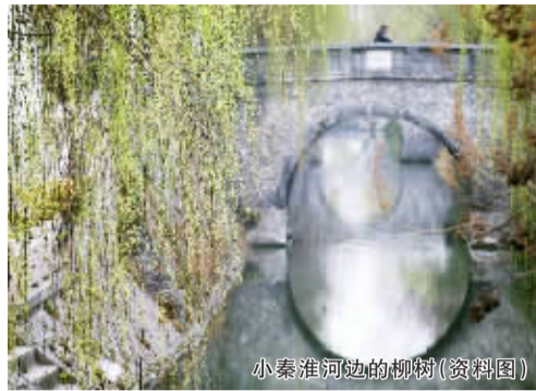
小秦淮河边的柳树(资料图)

银杏被称为中国的“国树”,全国古银杏以江苏最多,扬州又居江苏省前列。经过植物学家考证,目前野生银杏的分布地是在浙江天目山,扬州古代的银杏也都是从那里过来的,经过长时间驯化后,已成为扬州的乡土树种。扬州城内百年以上的银杏有100株左右。