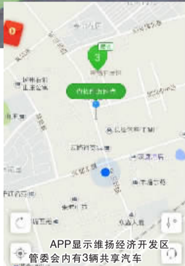
APP显示维扬经济开发区管委会内有3辆共享汽车