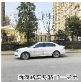
西湖路车身粘了一层土