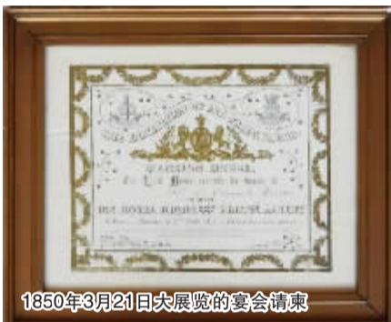
1850年3月21日大展览的宴会请柬