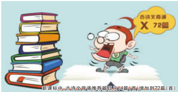
新课标中,古诗词背诵推荐篇目从14篇(首)增加到72篇(首)

能的掌握程度,引导教学更加关注育人目的。研制了学业质量标准,把学业质量划分为不同水平,可以帮助教师更好地把握教学要求,因材施教,也为考试