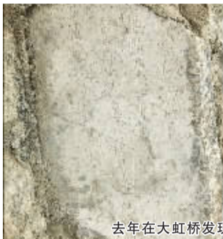
去年在大虹桥发现的曹寅残碑拓片

“扬州繁华以盐盛——两淮盐业与扬州”，将于4月20日至6月20日期间在扬州博物馆二楼书画厅，与公众见面。扬州博物馆工作人员介绍，此次展览共展出60余件展品。其中，去年在大虹桥修缮中发现的曹寅残碑首次公开亮相。另外，扬州博物馆藏的林则徐画像也将出现在展览中，此画作者不可考，光绪年间江都徐兆丰题记，赞扬林则徐力主对外御敌，表达自己的政治主张。