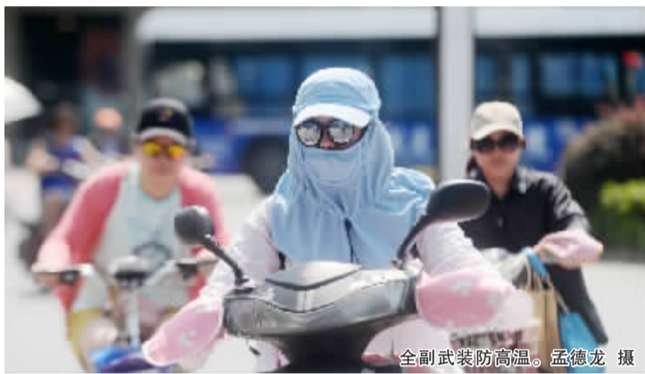
全副武装防高温。