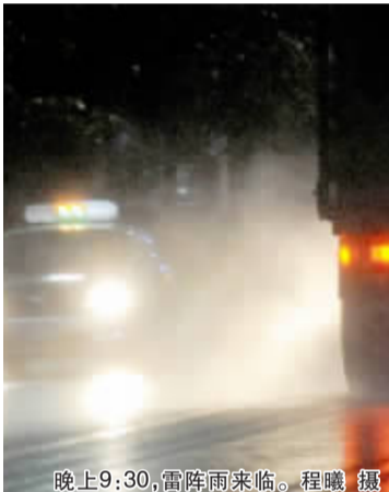
晚上9:30,雷阵雨来临。程曦 摄

36.6℃,仪征36.5℃,高邮36.3℃,宝应34.8℃。网友们纷纷表达了对高温的欲哭无泪。要知道昨天上午11点,全市气温已经到了34℃左右,高温暴晒了差不多整个白天。