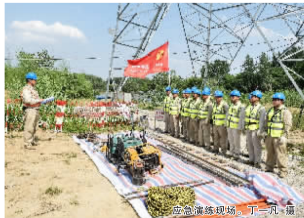
应急演练现场。

据介绍,此次应急演练,共有市应急办、市安监局、市气象局、市质监局、市水利局、市消防支队、市交警支队、军分区、中国移动江苏扬州分公司、国网江苏省电力公司检修公司扬州分部等12个单位,160余人次,30余辆各类抢修车辆共同参与。