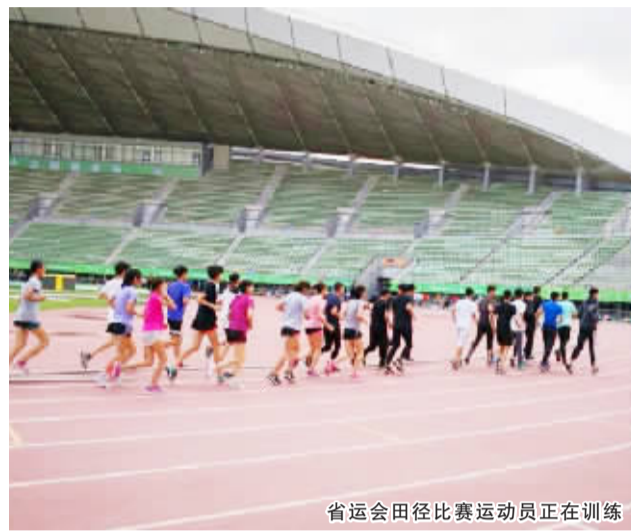
省运会田径比赛运动员正在训练