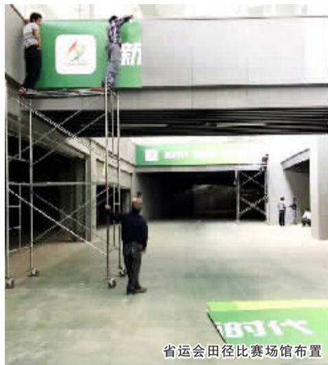
省运会田径比赛场馆布置

明天，江苏省第十九届运动会青少部田径比赛即将在扬州开赛。昨天，参赛运动员已抵达扬州，并开始赛前准备。被市民亲切誉为“扬州碗”的扬州体育公园体育场是本次比赛场地，这也是主场“扬州碗”承接的第一项省运会赛事，目前“扬州碗”内的布置工作正在如火如荼的进行，将于今晚完成所有布置。