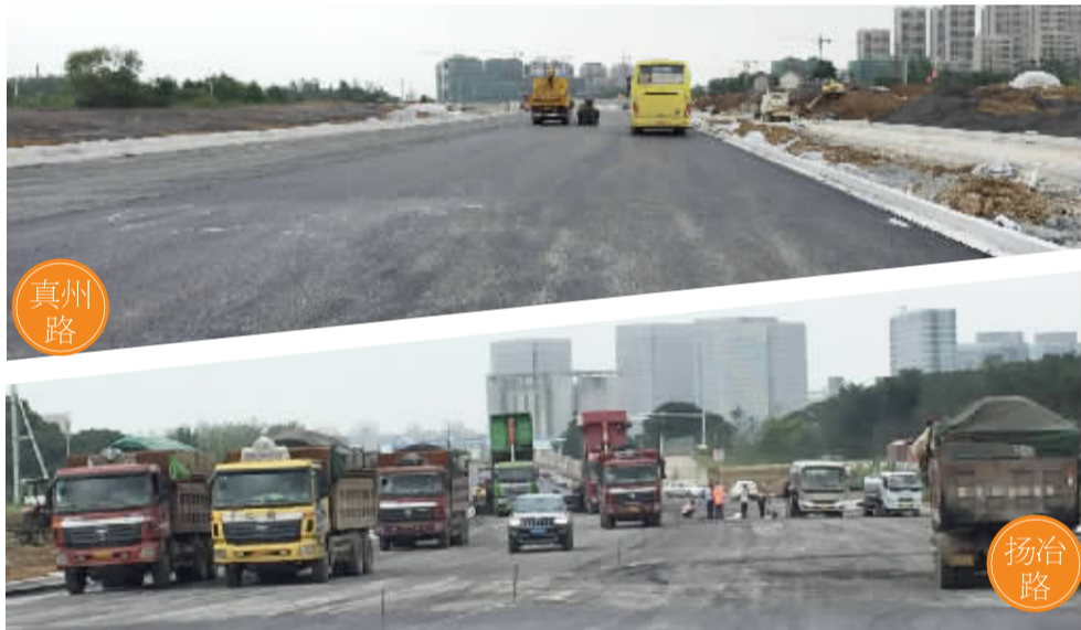
扬州路真州路开铺沥青

本次征求平行志愿包括军事、公安政法、航海、地方重点高校招收农村和贫困地区学生专项计划、乡村教师定向培养计划以及其他院校共6类计划。